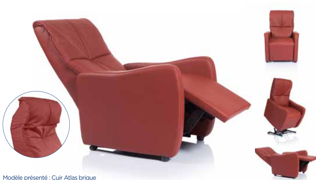
Modèle présenté : Cuir Atlas brique